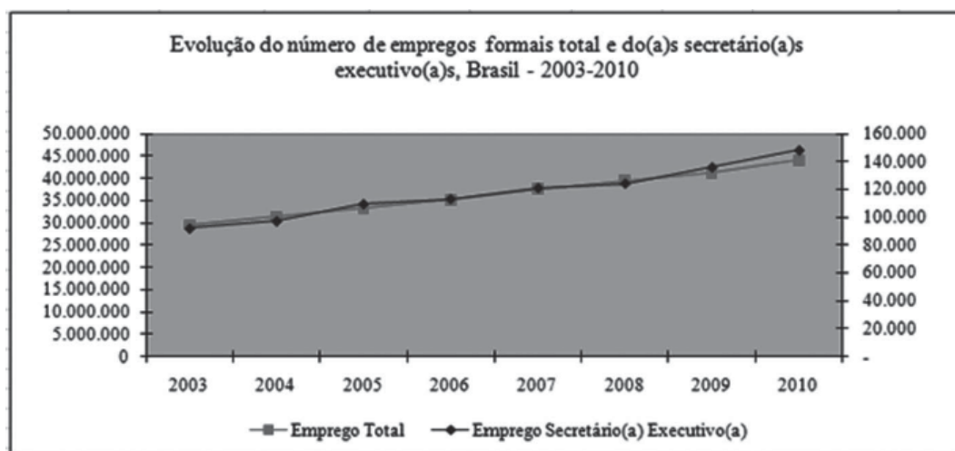
Figura 1 - Evolução do total do número de profissionais secretários executivos empregados formalmente no país em comparação ao aumento do emprego total no Brasil – 2003-2010

Outro ponto que merece destaque é o fato de que o crescimento se manteve constante no período e que em poucos momentos a profissão apresentou crescimento inferior ao nacional: inclusive, em 2010 a profissão ultrapassou a média nacional.