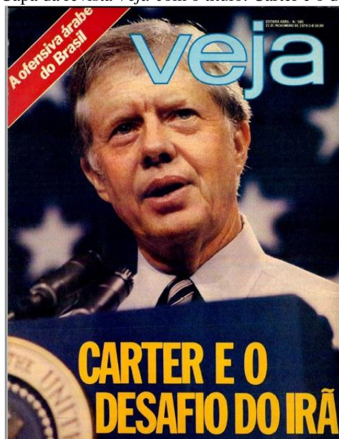
Figura 3 – Capa da revista Veja com o título: Carter e o desafio do Irã