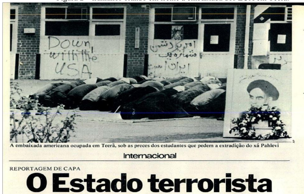
Figura 2 – iranianos orando em frente à embaixada dos EUA em Teerã.