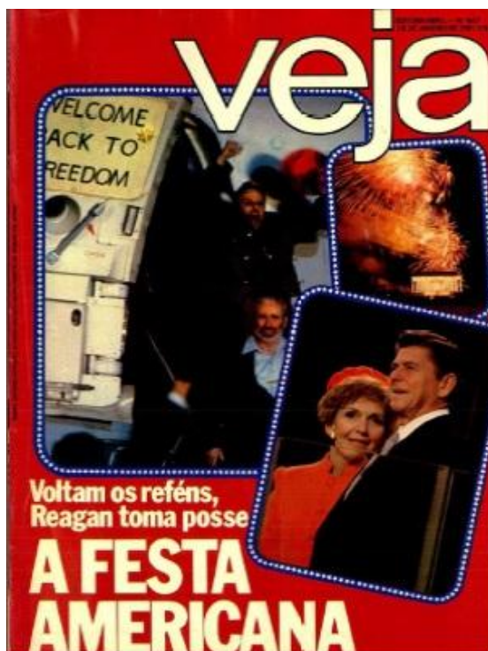
Figura 3 – Capa da revista Veja com o título: A festa americana