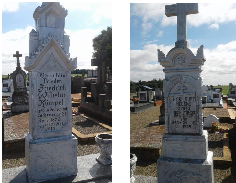
Fotografia tirada em 08/04/2018.

Ilustração 02 - Lápide de homenagem à família Kämpel instalada ao lado da igreja.