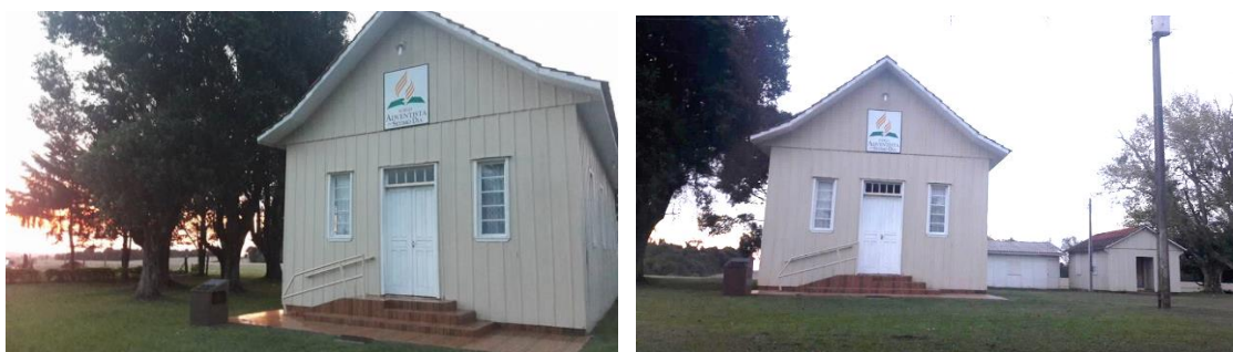
Ilustração 06 - Imagem atual do entorno da igreja.

Fotografia tirada em 08/04/2018.